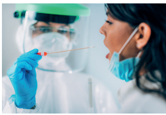
Service de dépistage de la COVID-19 ou des urgences

Les exemples suivants illustrent les habiletés PRP lors des entretiens en télémédecine et en présentiel. Ils peuvent servir dans pratiquement tous les contextes, spécialement lorsque les émotions sont à fleur de peau.